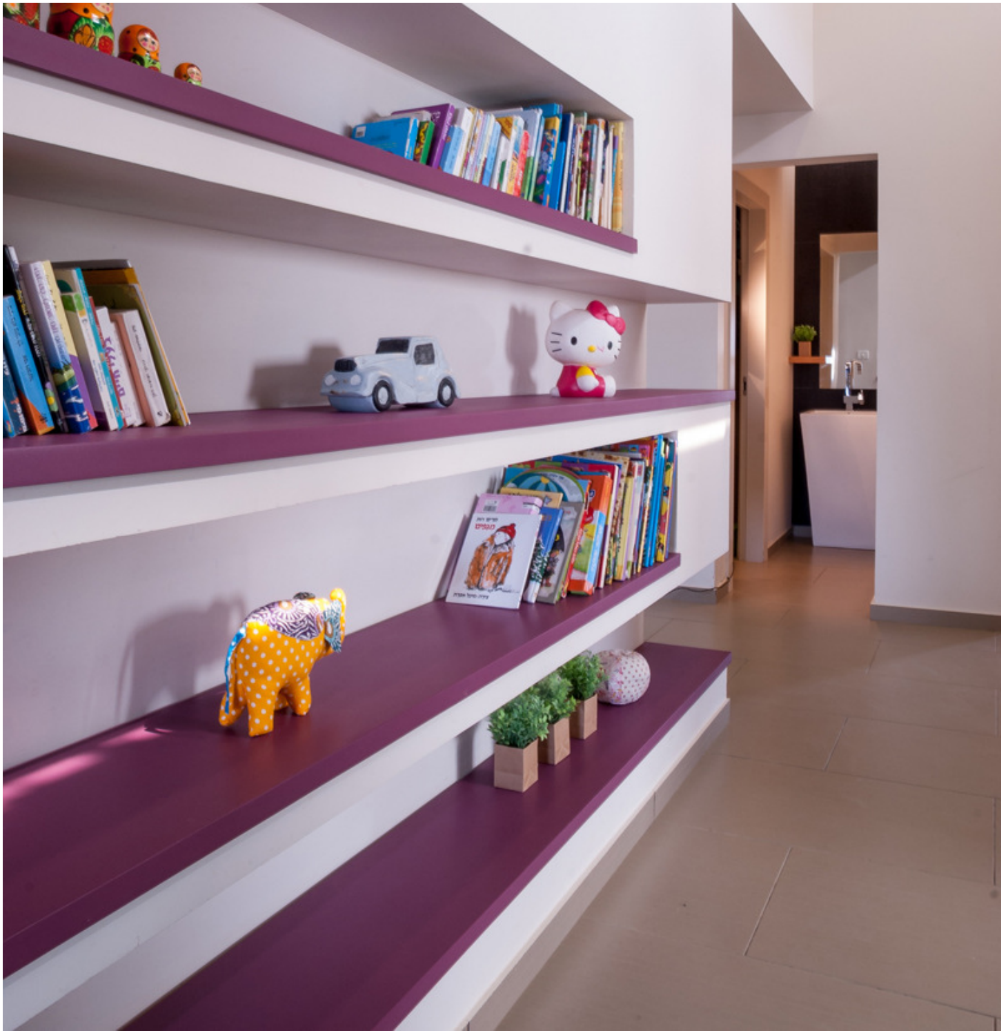
הספרייה במסדרון שמיועדת לכל בני הבית