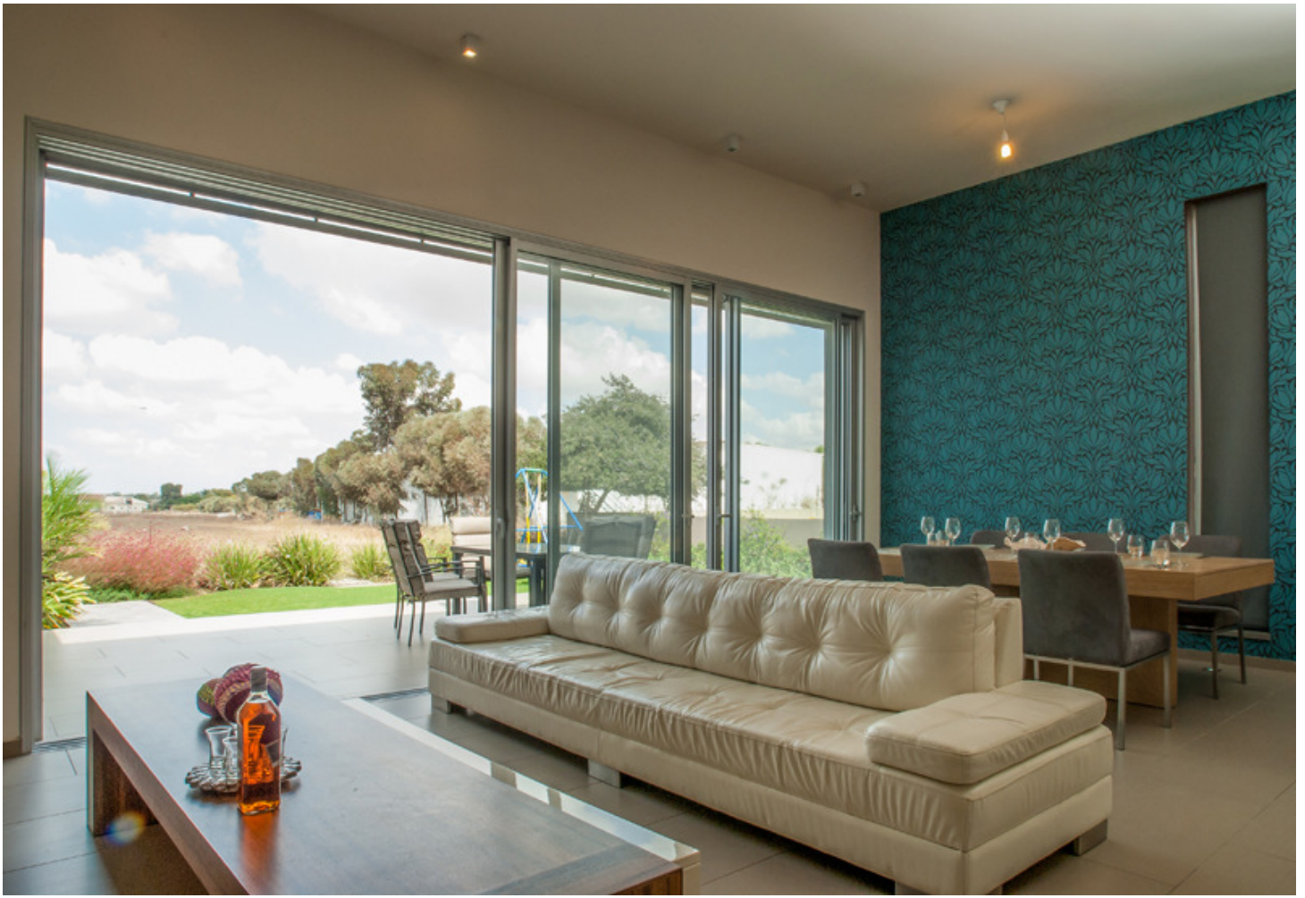
מבט מהסלון אל החצר והגolf הפתוח