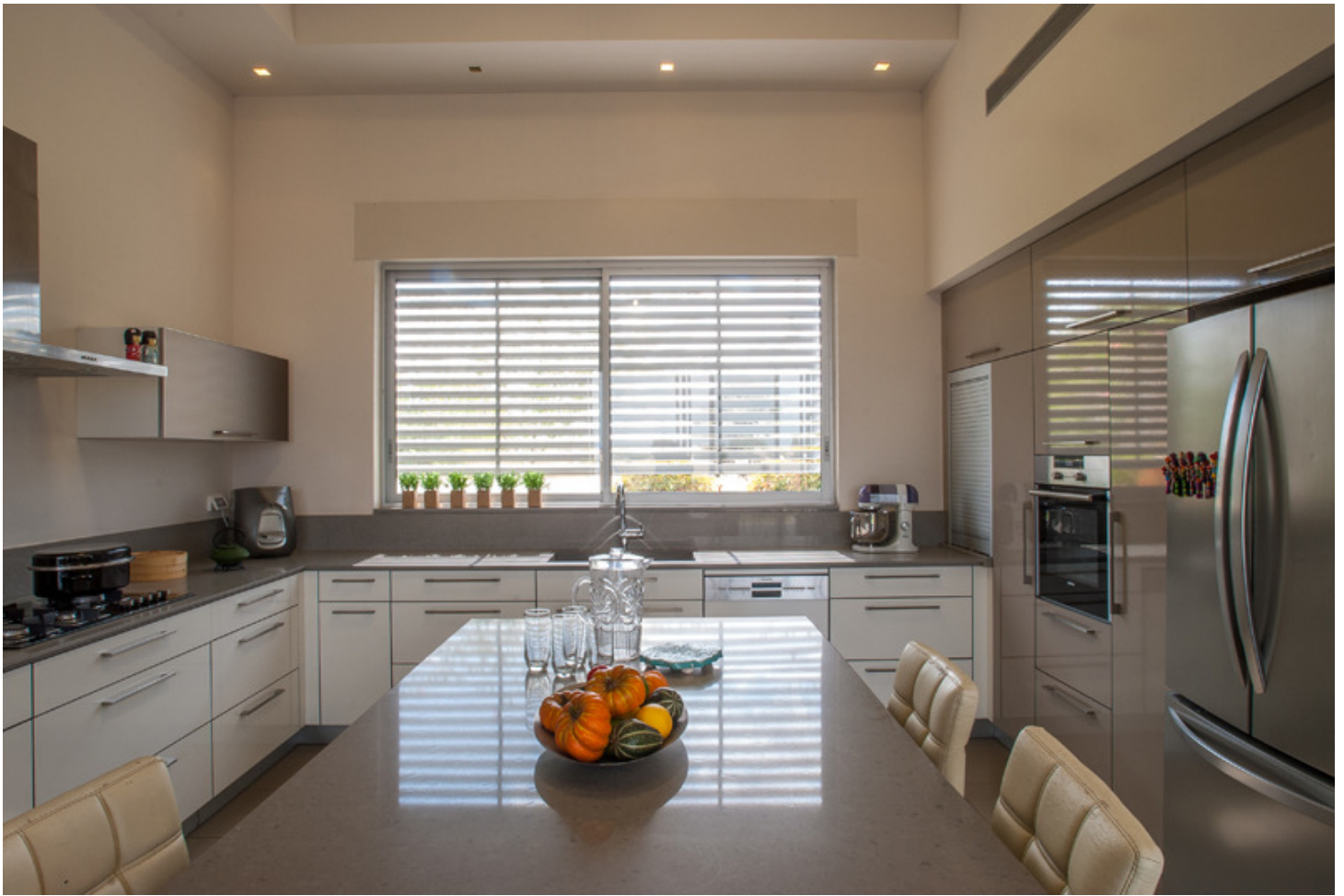
לבן ואפור משתלבים