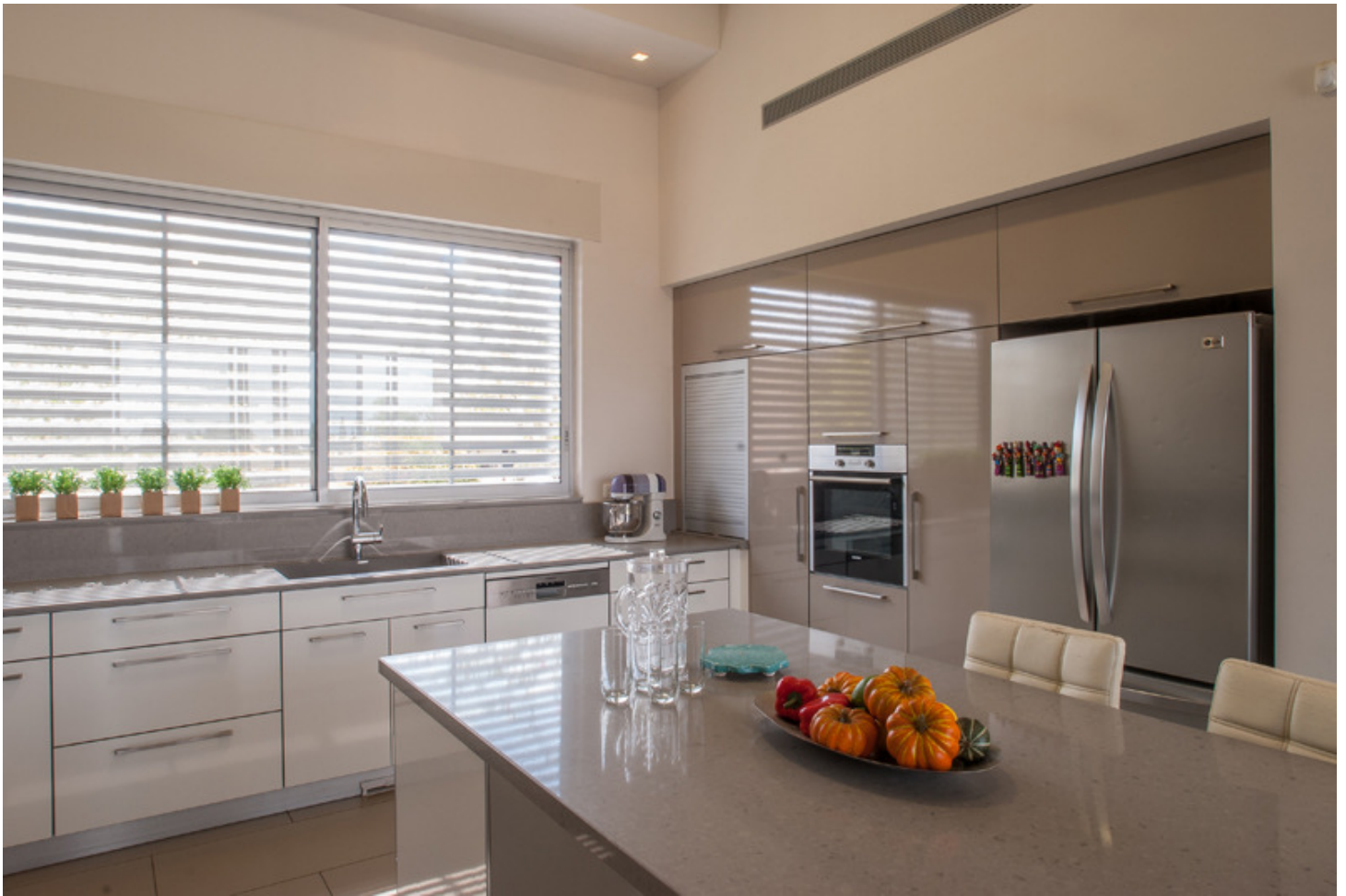
מטבח גדול עם אי במרכז