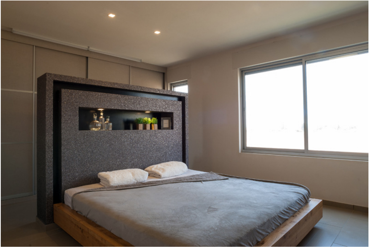
חדר השינה של ההורים עם ארון קיר מאחור