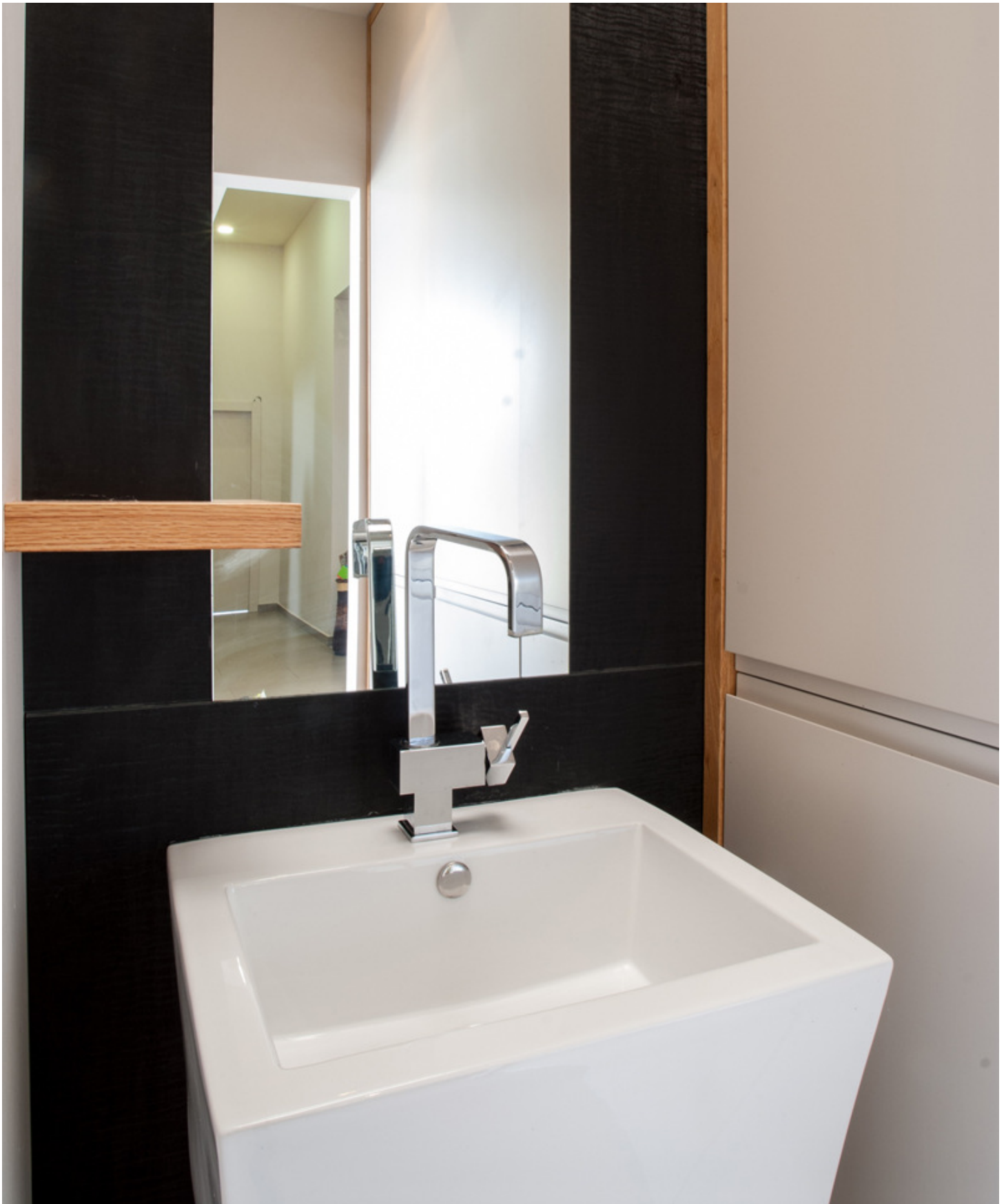
שירותי אורחים בקצה המסדרון

בחלל הפרטי נמצא חדר השינה של ההורים, שלושה חדרי ילדים, ממ"ד שמשמש כחדר עבודה וחדר כביסה. אזור החדרים למעשה מחולק לשניים – חדרי הילדים שפונים לחזית חדרי הילדים ויחידת ההורים שפונה לחצר האחורית, כשבין שני החלקים מפרידים הממ"ד וחדר הכביסה.