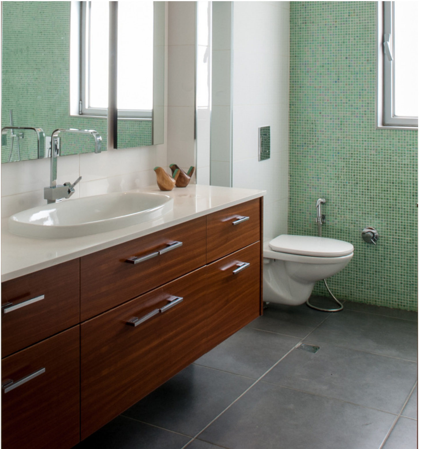
חדר רחצה בצבעים בהירים