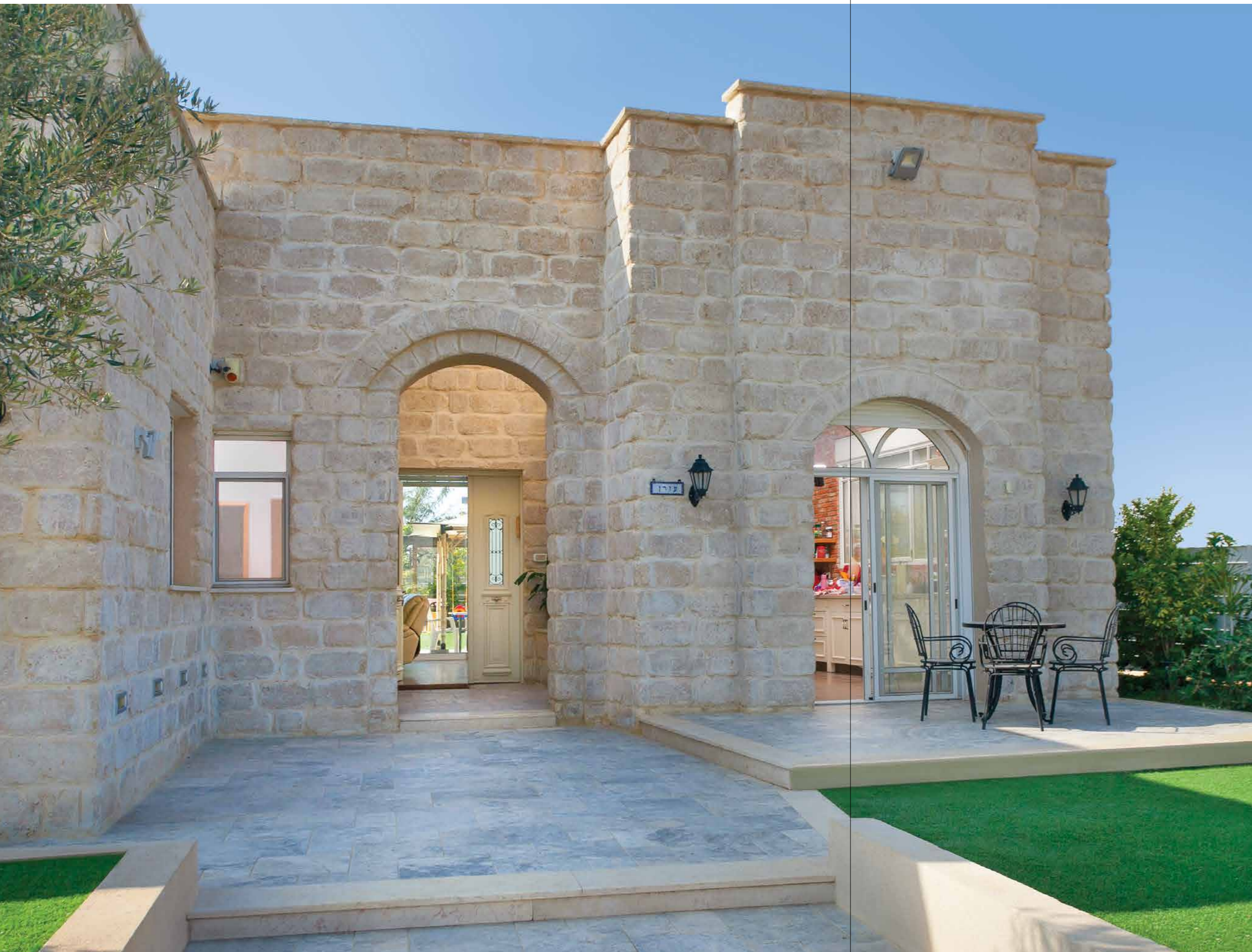
אבן לחיפוי דגם "ענתיקו" גוון כורכרי. אדריכלות: רון ושריתה פלד.