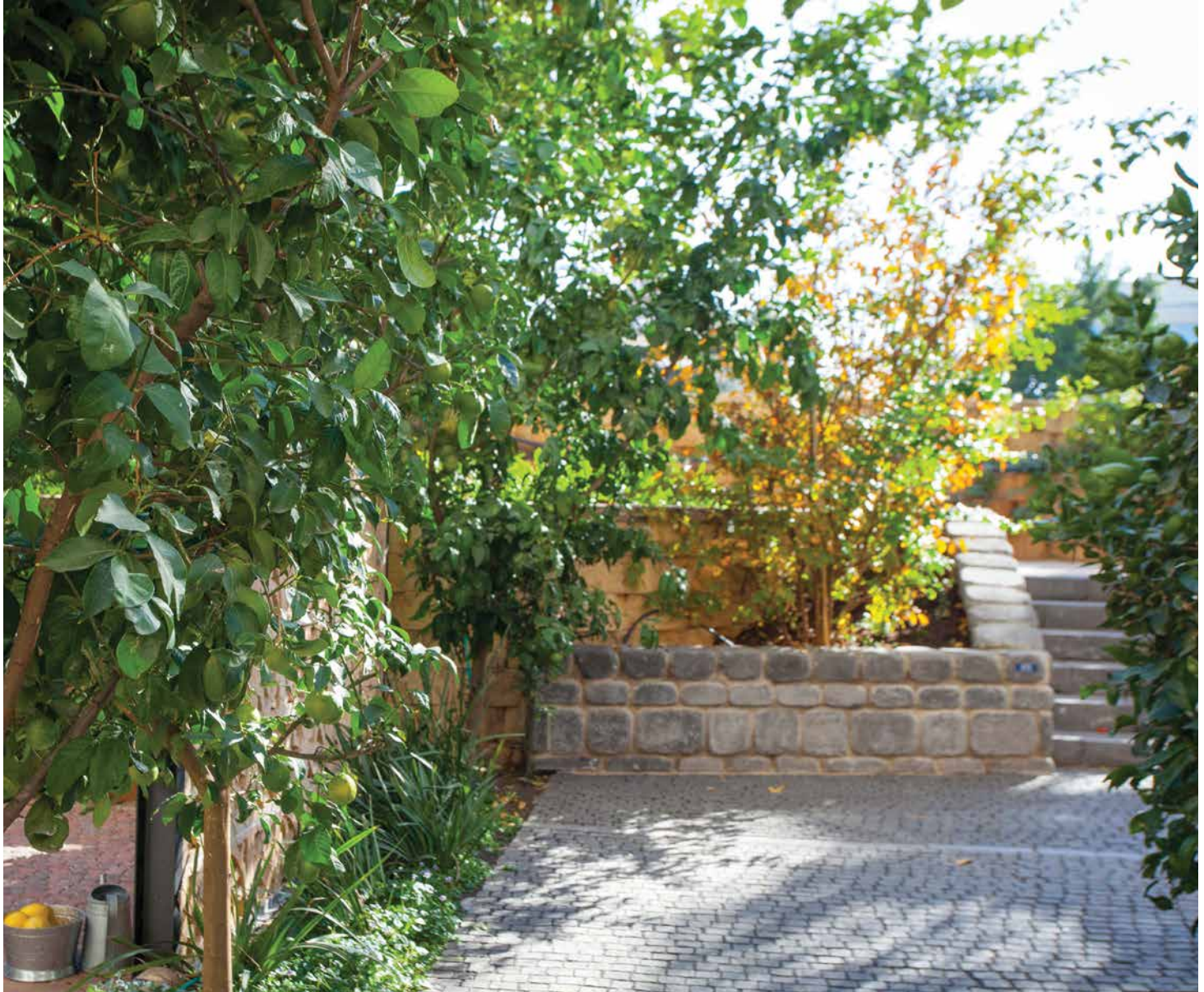
ריצוף באבן דגם 'פורטו' בגוון שחור בזלתי. אבן לחיפוי דגם 'ענתיקו' בגוון שחור בזלתי.

הפתרון נמצא בחברת 'אקרשטיין HOME', המתמחה בייצור אלמנטים לבנייה פרטית העשויים מאגרנטים טבעיים. בין יתר המוצרים החדשים הנראים ומרגישים בדיוק כמו אבן טבעית, בולטים הכורכר והבזלת