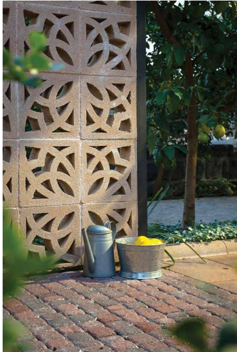
משרבייה דגם רקפת 6 גוון כורכרי. ריצוף באבן רמות בגימור 'ענתיק' בגוון אדום עתיק.

אבן גירית קיימת בהרי ירושלים והצפון. בגליל ניתן גם למצוא אבן בזלת ובאזור השפלה והחוף נמצא הכורכר, אולם גם הכמות של אוצרות אלה מוגבלת, ובכדי לשמור על הקיים חל איסור על כרייתם למטרות בנייה